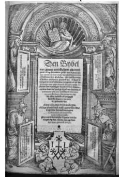
Titelpagina van de Liesvelt-Bijbel