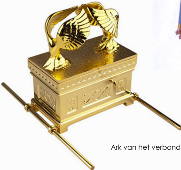
Ark van het verbond