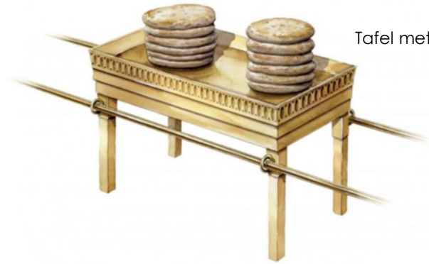
Tafel met de broden (Pinterest)