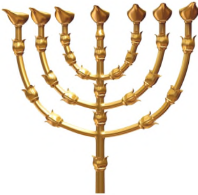
De gouden kandelaar